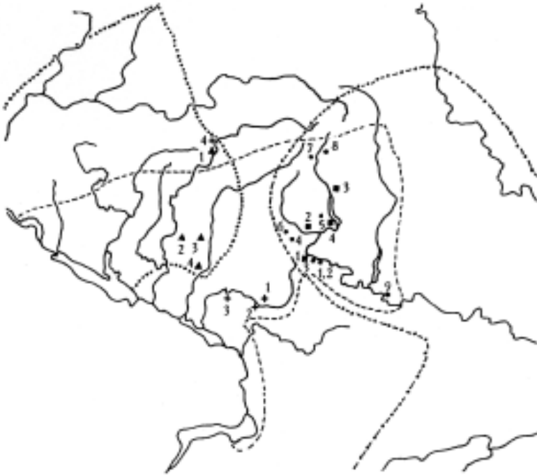
Рис. 3. Этнокультурная ситуация в Днепро-Донецком междуречье VII–нач. VIII вв.: