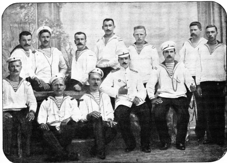
Рис. 2. Фотография членов команды броненосца «Потёмкин». Лейтенант в центре группы – одна из жертв бунта. Фото 1905 г.

матросов, но и по доставке на корабль свежей рыбы, чтобы разнообразить матросский стол [19, с. 10-11; 12, с. 218, 222].